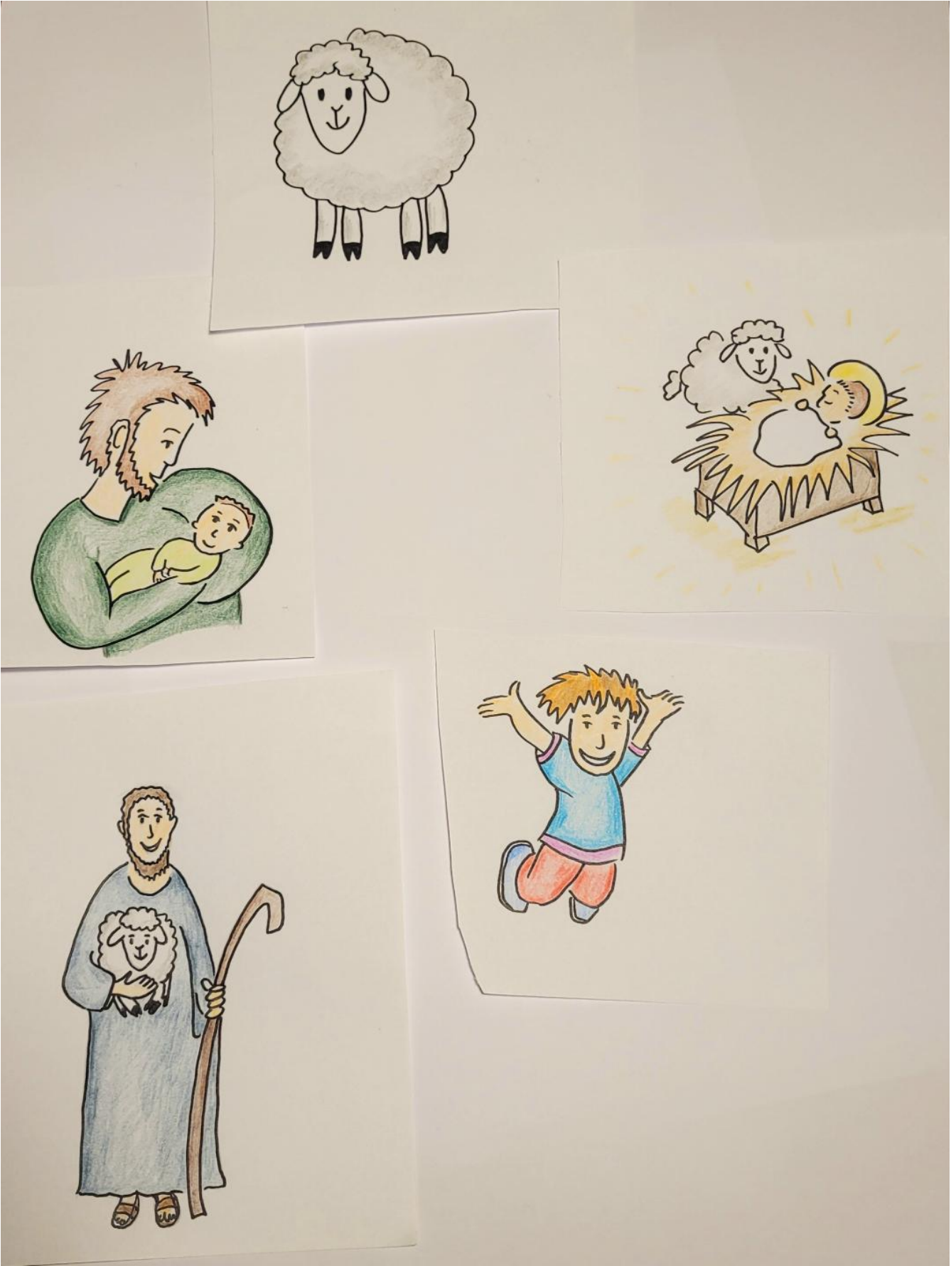
Schaubild in bunt